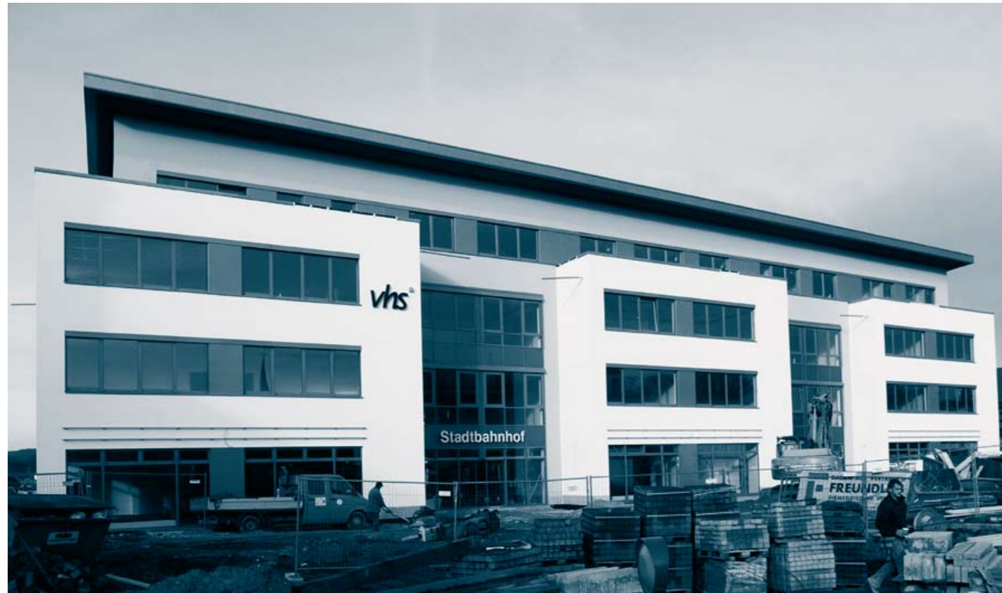
Im Januar beziehen die VHS als Hauptmieter und die weiteren Nutzer des komplett vermarkteten Stadtbahnhofs ihre Räume.