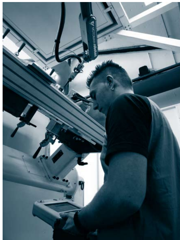
Ein Roboter erledigt Schweißarbeiten an den Profilrahmen.

Auf fast 15.000 Quadratmetern Produktionsfläche fertigt HARTAL, als europäischer Marktführer, für die weltweite Kundschaft qualitativ hochwertige Reisemobil- und Wohnwagentüren, Stauraumklappen, Dachhauben, Relings, Leitern, Verdunklungs- und Mückenschutzrollos. Dabei macht der Bereich Türen mit rund 100.000 Stück pro Jahr knapp 70 Prozent des Gesamtumsatzes aus. Die Abnehmer schätzen an den HARTAL-Türen, dass sie die Qualitätsmerkmale