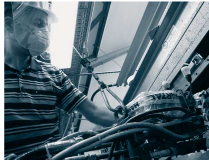
PU-Schaum wird zwischen die Kunststoffschalen gepresst.

eines geringen Gewichts, einer hohen Stabilität und einer guten Wärmedämmung in sich vereinen. Und der Kunde profitiert davon, dass neue Entwicklungen in enger Kooperation mit HARTAL erfolgen.