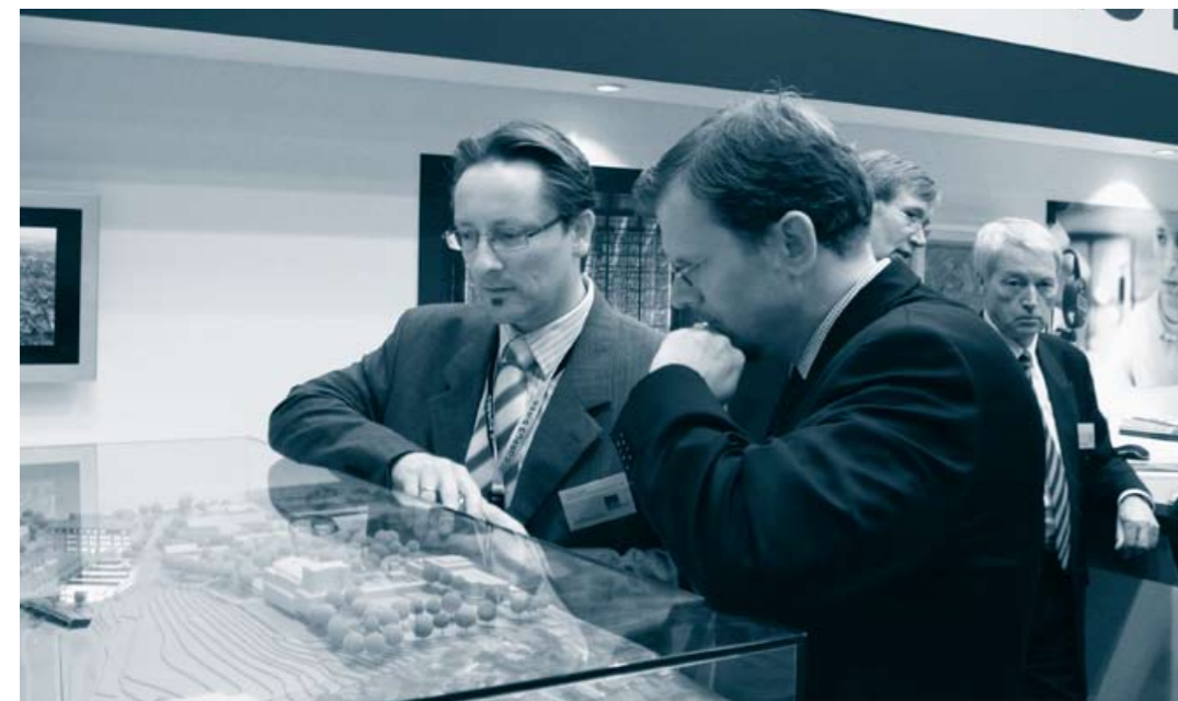
Großes Interesse fand das Modell des Bahnhofareals, das die GfW vorstellte.