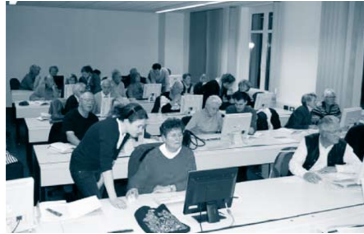
50 Teilnehmer beschäftigen sich im Rahmen des Projektes „Horizonte“ intensiv mit neuen Medien.