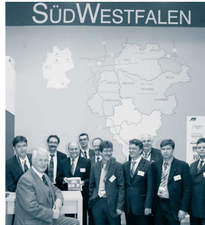
Die Standpartner vor der Südwestfalenkarte.

In der extra für die EXPO REAL aufgelegten Broschüre „Südwestfalen“ präsentiert sich die Region als idealer Wirtschaftsstandort, der mit Tradition und Zukunft in einer grünen Umgebung über viel Potenzial verfügt. Auf dem Messestand konnten sich die zahlreichen Interessenten über die Kompetenzen und die wirtschaftliche Spitzenstellung der Region informieren. Der von der Prognos AG erstellte Zukunftsatlas sieht diese vor allem in den Bereichen Automotive,