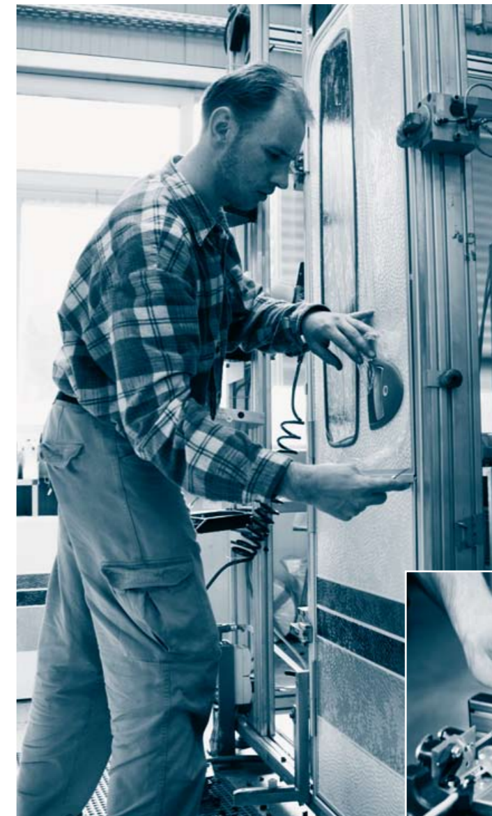
Die Endmontage der Caravan-Türen erfordert viel Handarbeit.