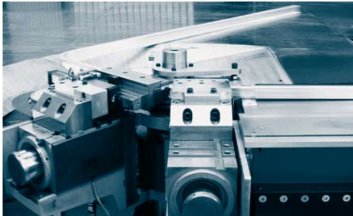
Erster Schritt: Aluminiumprofile werden in Form gebogen.

Die Produktion für Hobby erwies sich für HARTAL als segensreich. Mit dem Aufstieg des Kunden von der Ostseeküste erlebte auch der Iserlohner Betrieb eine Blüte-