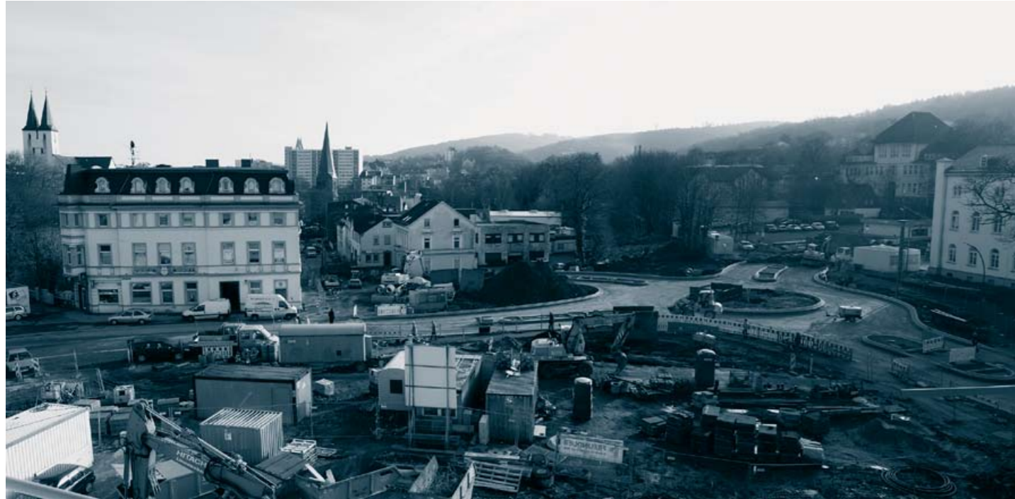
Kreisverkehr und Vorplatz warten noch auf die endgültige Gestaltung. Hier steht auch noch ein weiteres Grundstück zur ab-rundenden Bebauung zur Verfügung.