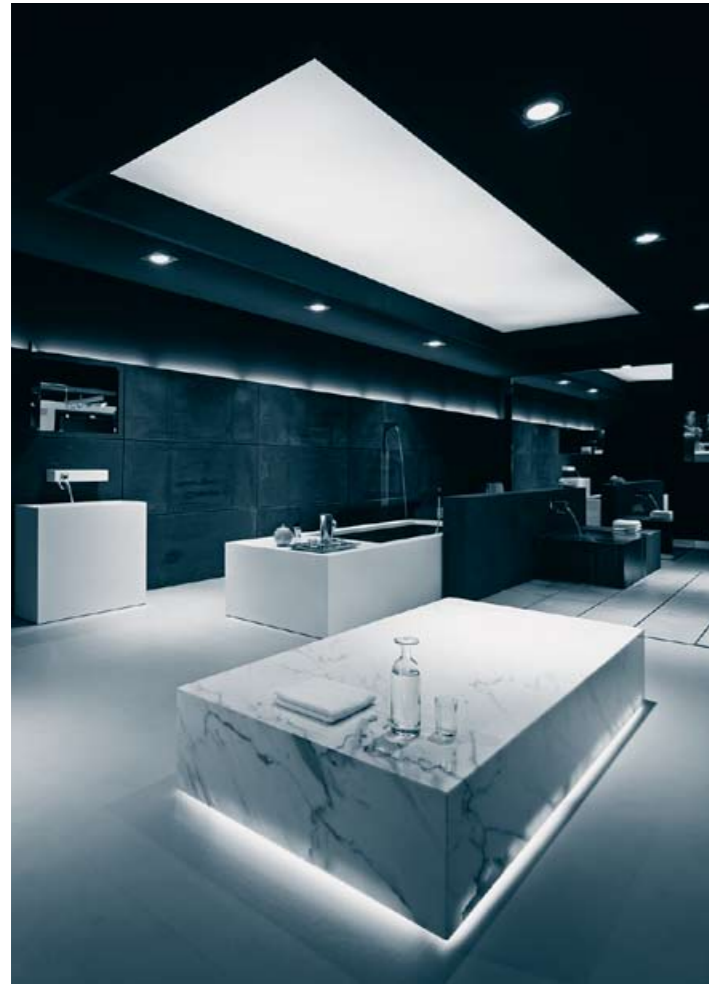
Als herausragende Messebeteiligung wurde der Dornbracht-Stand bei der ISH 2007 ausgezeichnet.