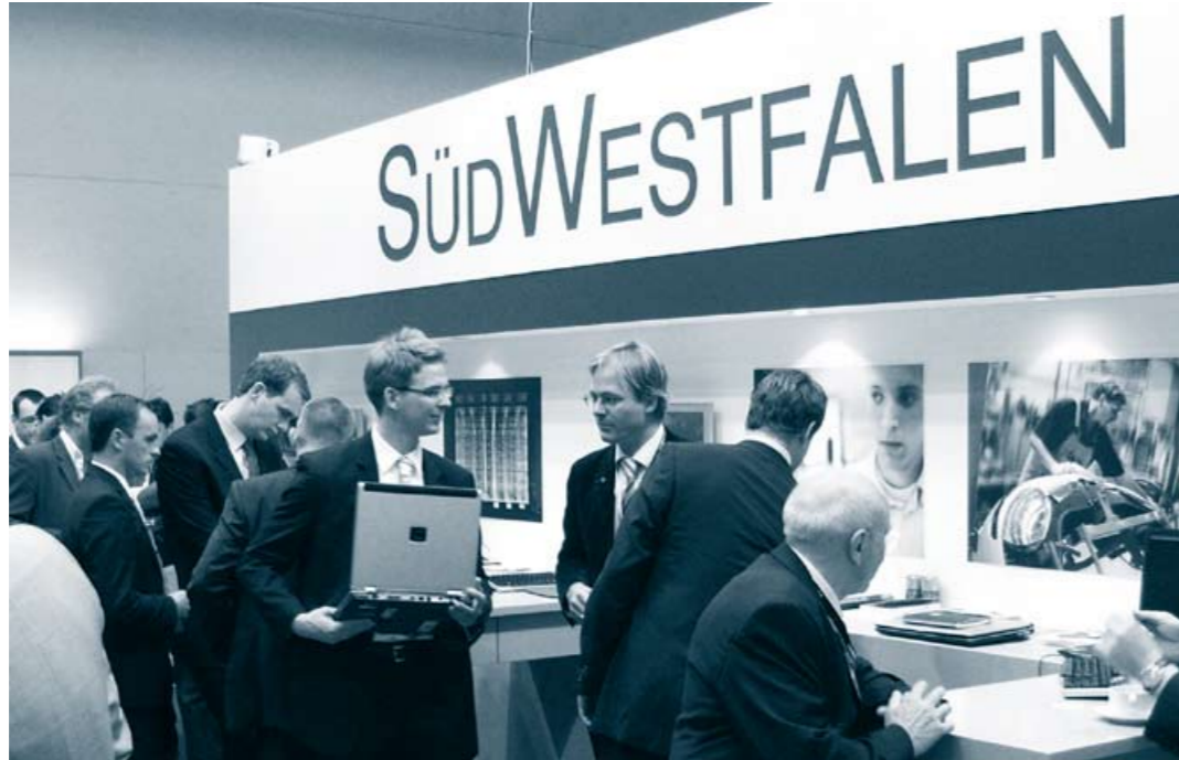
Südwestfalen präsentierte sich als Wirtschaftsregion erstmals mit einem Stand.

Mit dem Messeauftritt in München wurde die begonnene interkommunale Zusammenarbeit in Südwestfalen konsequent fortgesetzt. Folgende Partner präsentierten Südwestfalen als attraktiven Investitionsstandort mit ausgewählten Immobilienprojekten und herausragenden Kompetenzen: Arnsberg, Brilon, Hochsauerlandkreis, Iserlohn, Kreis Soest, Lippstadt, Lüdenscheid, Märkischer Kreis, Meschede, Soest, und